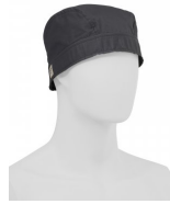
GRIS HIERRO 13067